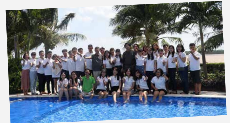
SS4S 2018 tại Bến Tre