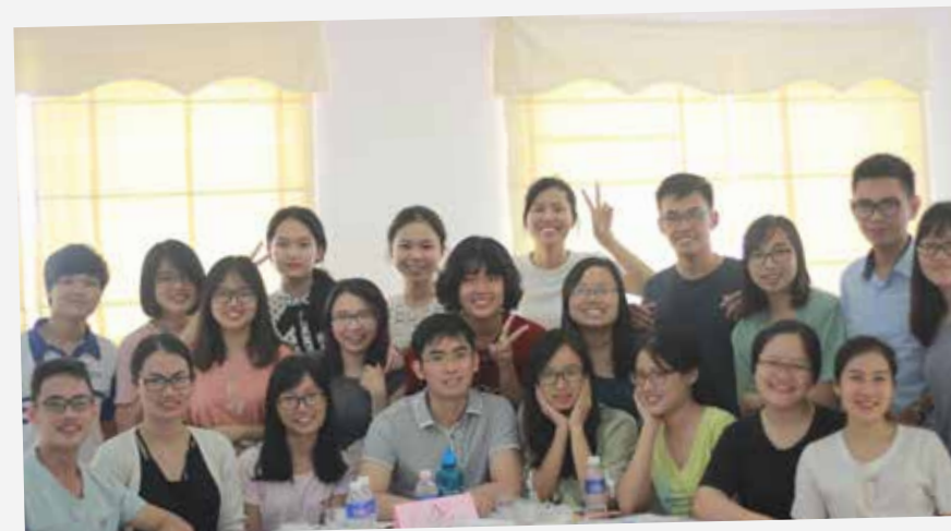
SS4S 2017 tại Ninh Bình