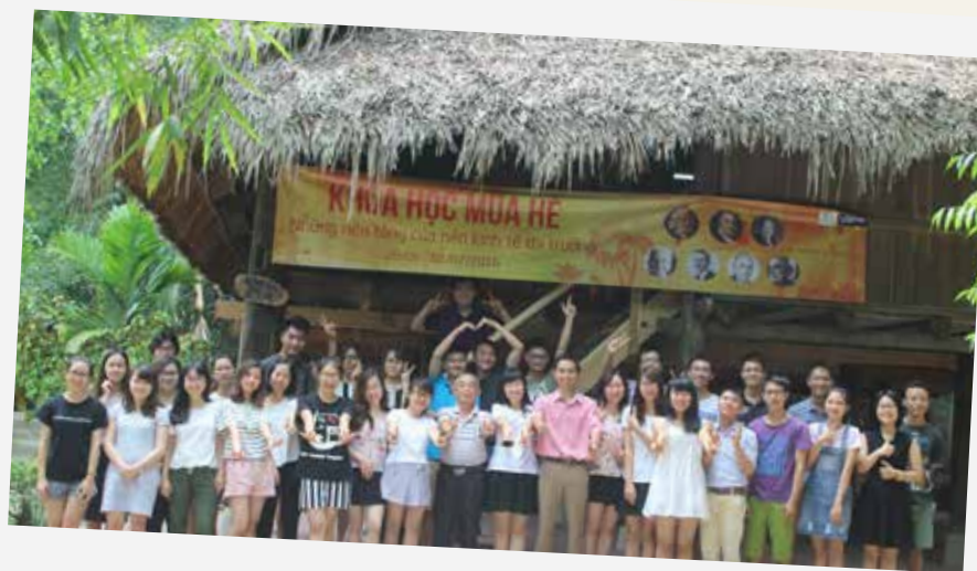
SS4S 2016 tại Thái Nguyên

Friedrich Naumann STIFTUNG FÜR DIE FREIHEIT